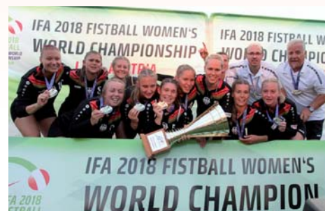
Die Weltmeisterinnen 2018