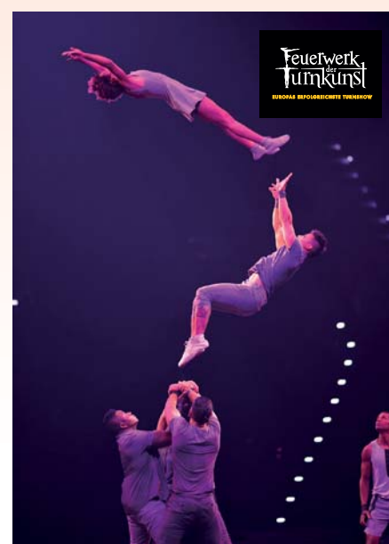
Vom „Feuerwerk“ begeistern lassen