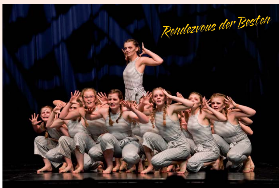
„Rendezvous der Besten“ – Sprungbrett in eine Showkarriere?

Turn NTB NEIDERÖSTERREICHISCHER TURNVERBUND Gala