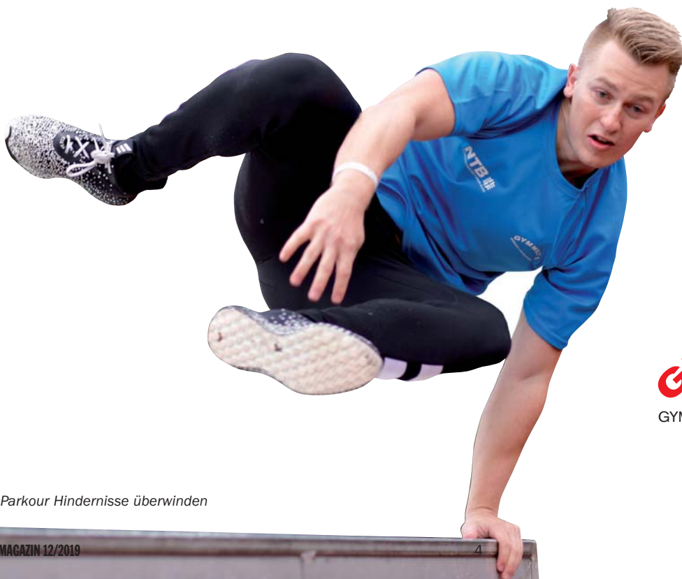
Mit Parkour Hindernisse überwinden