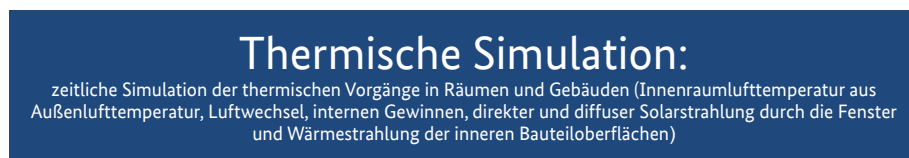
Abb. 6.2: Definition „Thermische Simulation“