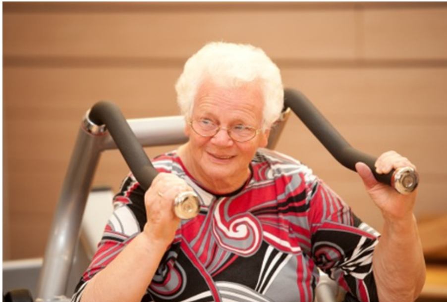
Abb. 5.1: Einfluss des demografischen Wandels auf Sporthallen