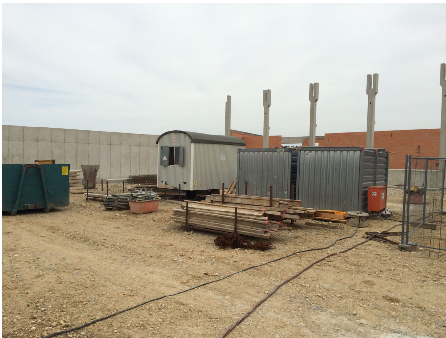
Abb. 4.1: Baustelle der Sporthalle „Am Sportpark, Zorneding“

Durch den Einbezug von Nachhaltigkeitsaspekten in die Ausschreibung kann die ökologische und soziale Gebäudequalität der Sporthalle erhöht werden, da die Bauprozentscheidungen nicht ausschließlich aus ökonomischen Gründen getroffen werden. Die Berücksichtigung von Nachhaltigkeitsaspekten bei der Auswahl von Firmen dient dem Ziel der Verbesserung der Bauqualität, der Förderung und des Erhalts von Arbeitsplätzen in der Region und der Durchsetzung von Umwelt- und Sozialstandards im Rahmen des Bauprozesses der Sporthalle (Bundesministerium für Umwelt, Naturschutz, Bau und Reaktorsicherheit, 2013).