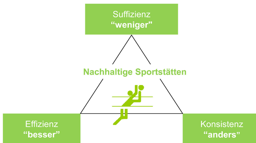
Abb. 2.5: Definition für nachhaltige Sportstätten

Zur Sicherung der Lebensqualität zukünftiger Generationen muss daher der nachhaltige und effiziente Umgang mit den Ressourcen unseres Planeten gewährleistet werden. Diese Forderung gilt als übergeordnetes Ziel auch für den Sportstättenbau. Betrachtet man die Auswirkungen der Baubranche auf die Umwelt, so ist deren Einfluss enorm. Der europäische Bausektor verbraucht etwa 50 Prozent der natürlichen Ressourcen sowie 40 Prozent der Energie und 16 Prozent des Wassers. Zudem verursacht das Bauwesen rund 60 Prozent aller Abfälle. Darüber hinaus resultieren rund 40 Prozent des weltweiten Ausstoßes von Treibhausgasen aus der Gebäudeherstellung und -nutzung (Ebert et al., 2010).