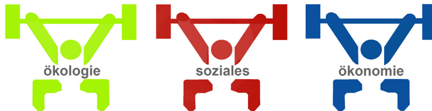
Abb. 2.3: Die drei Dimensionen der Nachhaltigkeit

Auch wenn die Verbindung zwischen Sport und Nachhaltigkeit nicht immer auf den ersten Blick ersichtlich ist, so sind doch zahlreiche vielfältige Verknüpfungen erkennbar. Hierbei kommt dem Raum, in dem der Sport betrieben wird, eine wichtige Rolle zu, sowohl in gesellschaftlicher, wirtschaftlicher als auch ökologischer Hinsicht.