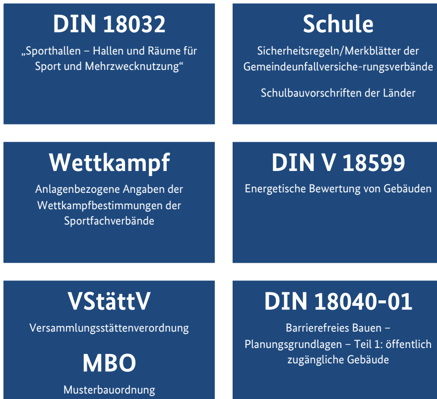
Abb. 3.2: Technische Regelwerke für Sporthallen mit Mehrzwecknutzung

Darüber hinaus haben Sportinstitutionen und -verbände sowie das Bundesinstitut für Sportwissenschaft (BISp) zahlreiche Informationsbroschüren veröffentlicht, die sich mit der Planung und dem Betrieb bzw. mit Teilbereichen des Sportstättenbaus befassen. Weitere ausgewählte Normen, technische Regelwerke Planungshilfen und Leitlinien zu Sporthallen sind in den jeweiligen Kapiteln zusammengefasst.