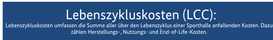
Abb. 9.1: Definition Lebenszykluskosten (LCC)

Der Neubau einer Sporthalle stellt für viele Kommunen, Vereine und private Investoren einen langwierigen Planungsprozess dar. Von der ersten Idee bis zur Inbetriebnahme der Sportstätte können dabei mehrere Jahre vergehen, bis alle planungsrelevanten und kostenspezifischen Themen geklärt sind. Denn eine Sporthalle verursacht über den gesamten Lebenszyklus hinweg hohe Kosten. Diese beziehen sich nicht nur auf die Errichtung, sondern auch auf deren Nutzung bis hin zum Abriss.