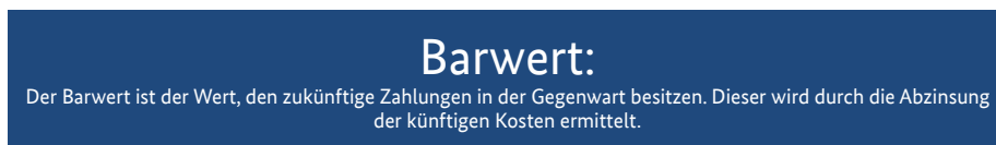
Abb. 9.2: Barwert (Bundesministerium für Umwelt, Naturschutz, Bau und Reaktorsicherheit, 2013)

Die Ermittlung der Herstellkosten für die Lebenszykluskostenbetrachtung einer Sporthalle erfolgt im Rahmen der Planung auf Basis der Kostenermittlung nach Fertigstellung der Halle mit Hilfe der Kostenfeststellung (Bundesministerium für Umwelt, Naturschutz, Bau und Reaktorsicherheit, 2016).