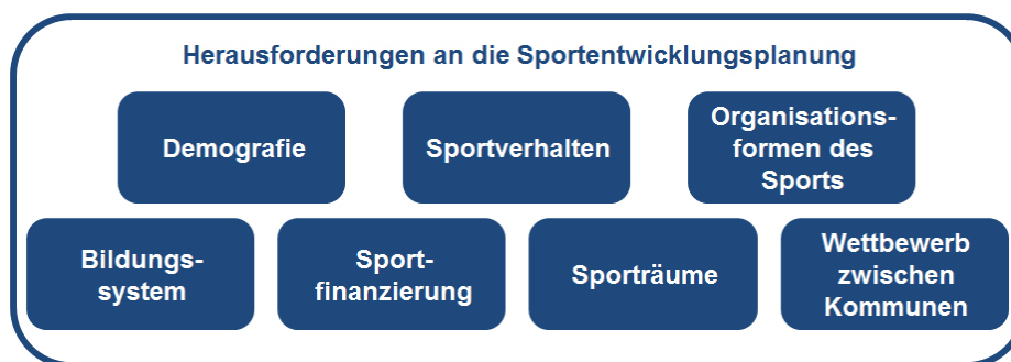
Abb. 3.1: Herausforderungen an die Sportentwicklungsplanung

Veränderungen in der Bevölkerungsstruktur, im Sportverhalten, im Bildungssystem oder bei den öffentlichen Haushalten sind nur einige der Herausforderungen, die auf die heutige Sportentwicklungsplanung einwirken. Folglich verändert sich die Nutzung und damit die Anforderungen an die Sporträume (Wetterich et al., 2009). Berücksichtigt man die Bedeutungssteigerung und die zahlreichen positiven sozialen Beiträge des Sports, so eröffnen sich darüber hinaus neue Handlungsmöglichkeiten für den Sportstättenbau (Ad-hoc-Ausschuss „Sportentwicklung“ der Deutschen Vereinigung für Sportwissenschaft, 2010).