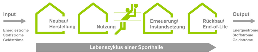
Abb. 2.9: Lebenszyklus einer Sporthalle (Essig, 2010)

Im Rahmen des Forschungsprojekts zum Leitfaden Nachhaltiger Sportstättenbau wurde auf die Kriterienstruktur des Bewertungssystems Nachhaltiges Bauen (BNB) des BMUB zurückgegriffen (Bundesministerium für Umwelt, Naturschutz, Bau und Reaktorsicherheit, 2013). Der bestehende Kriterienkatalog für den Neubau für Büro- und Verwaltungsbauten wurde hinsichtlich der Gebäudetypologie „Neubau Sporthalle“ analysiert und neue Kriterien für den Sporthallenbau nach Bedarf ergänzt.