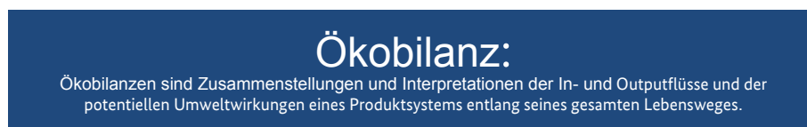
Abb. 8.1: Definition Ökobilanzierung

Derzeit spielt in der Planung von Sporthallen jedoch der Lebenszyklus in seiner Gesamtheit keine entscheidende Rolle. Während beispielsweise für die Kosten meist nur die Herstellungsphase maßgebend ist, wird für die energetische Bilanzierung nur die Nutzungsphase herangezogen. Im Sinne einer effizienten Nutzung von Ressourcen gilt es jedoch, diese Sichtweise aufzuheben und den gesamten Lebenszyklus zu analysieren.