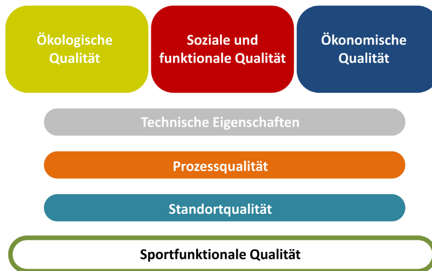
Abb. 2.8: Aspekte des nachhaltigen Sporthallenbaus

Für die Planung und Beurteilung der nachhaltigen Gebäudequalität von Sporthallen gilt es daher, gleichberechtigt ökologische, ökonomische und soziale Faktoren zu berücksichtigen. Zudem werden die technische Charakteristik, die Prozessqualität und der Standort des Gebäudes beurteilt. Für die Typologie der Sportraumplanung und des Sportstättenbaus gilt es, ergänzend die sportfunktionale Qualität zu integrieren.